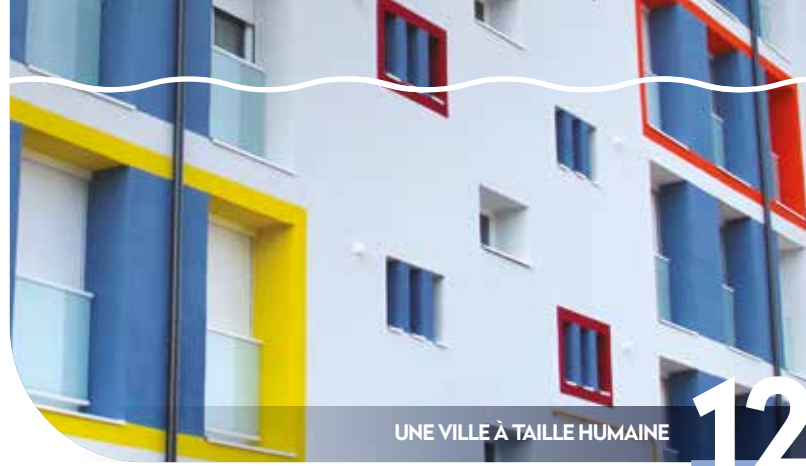
UNE VILLE À TAILLE HUMAINE