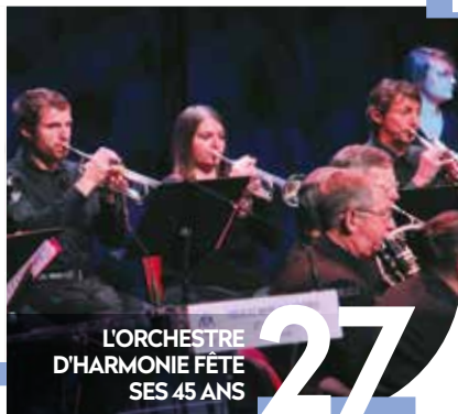
L'ORCHESTRE D'HARMONIE FÊTE SES 45 ANS