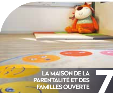
LA MAISON DE LA PARENTALITÉ ET DES FAMILLES OUVERTE