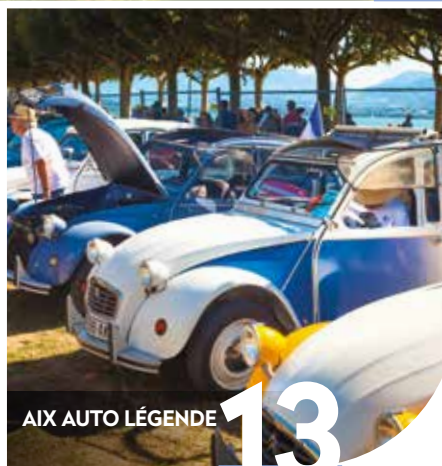
AIX AUTO LÉGENDE