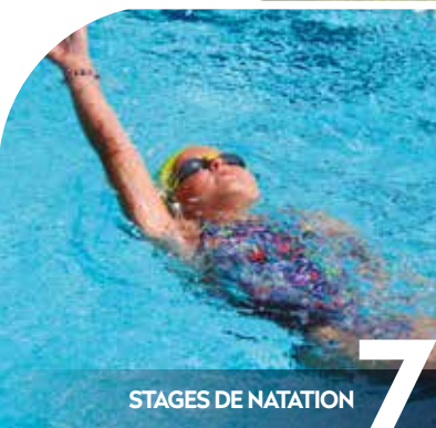
STAGES DE NATATION