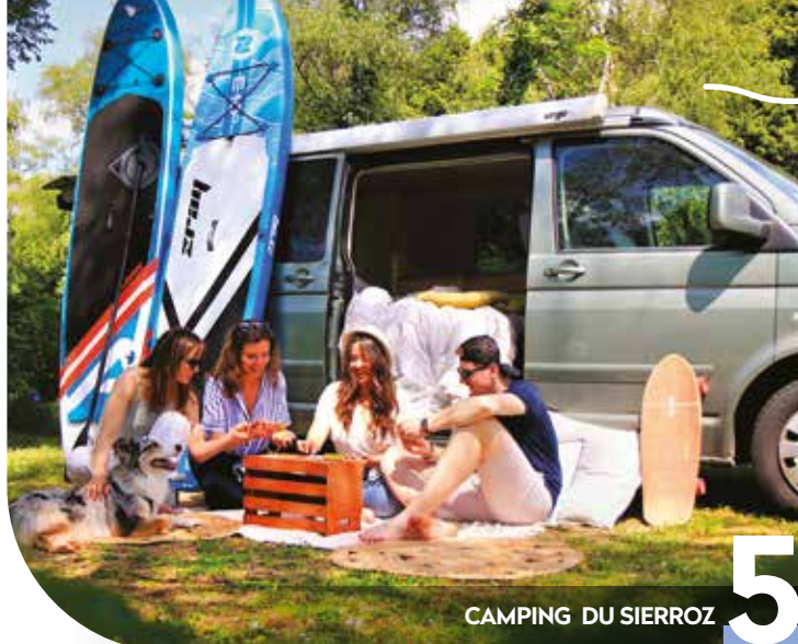
CAMPING DU SIERROZ